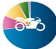
خودرو - صنایع موتوری 524374