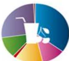
فرآورده های غذایی 859163