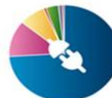
صنایع الکترونیکی 552095