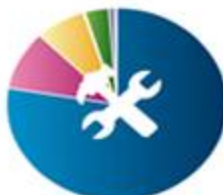
ابزار برای 284141