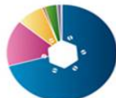
آهن و فلزات 324024