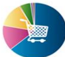
تجارت و ابزار 234560