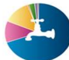
صنایع آب، گاز و صنایع حرارتی 475254