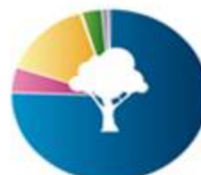
چوب و مواد چوبی 180806