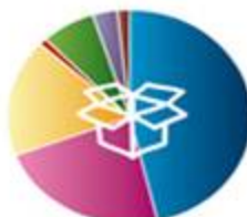
بسته بندی 248459