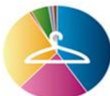
لباس و کفش 612747