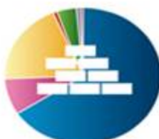
مصالح ساختمانی 1099351