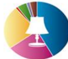
مبلمان و داخلی 671127