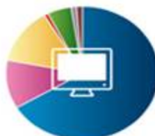
لوازم خانگی 208932