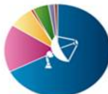
دستگاه های انوماتیک 290815