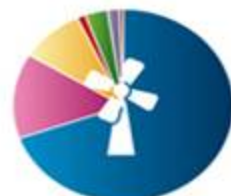
انرژی و معدن 169287