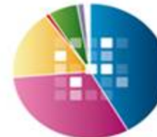
نساجی و چرم 255152