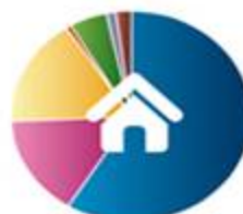
خانه و باغ 254515